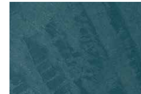
Romanita | G18