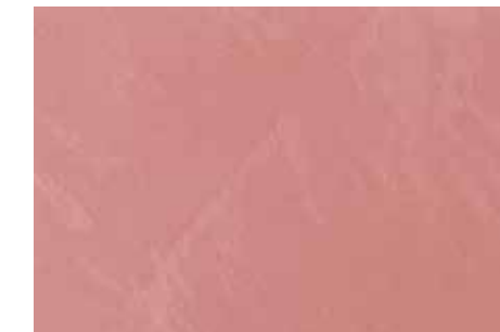
Cashmere | G25