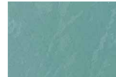
Lana | G21