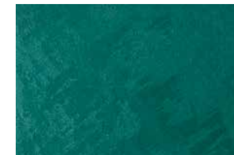
Chiffon | G20