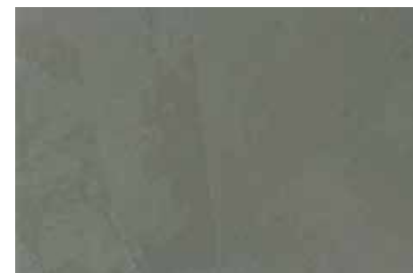
Tela | G14