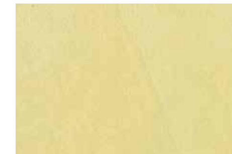
Taffetà | G23