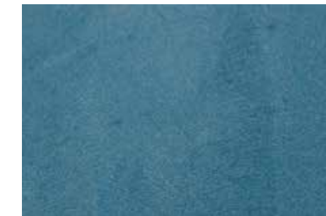
Seta | G19