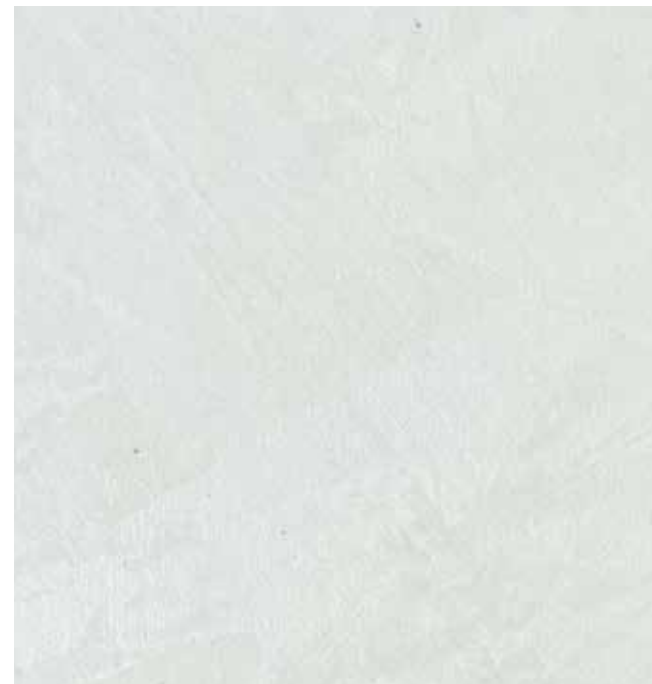
EFFETTO: Seto Base