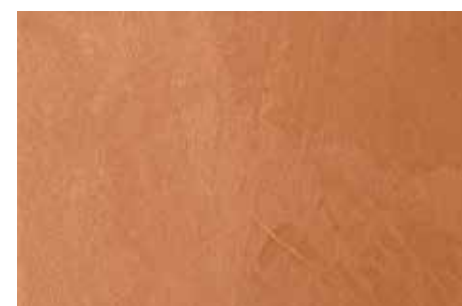
Flanella | G16