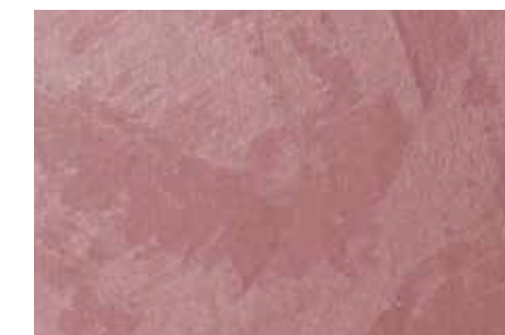
Duchessa | G24