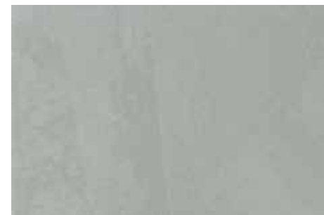
Organza | G13