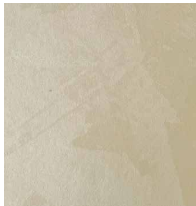
EFFETTO: Oriento Lino | G11