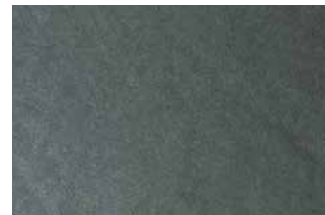
Poliestere | G12

Acrylpachtelmasse mit Edelmetallpigmenten auf Wasserbasis für den Innenbereich. Es ermöglicht Ihnen, elegante Dekorationen mit besonderen Reflexionen in verschiedenen Farbtönen und Nuancen zu kreieren.