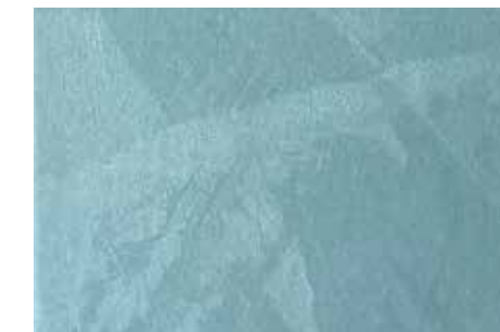
Raso | G22